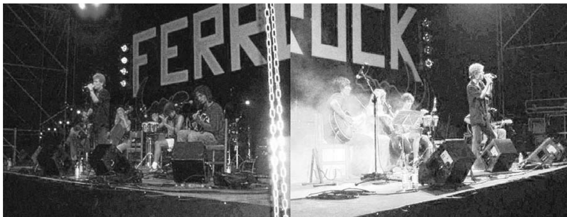
Il Ferrock, una delle poche feste vicentine ancora in vita

Sicuramente gli inizi furono quelli, entusiasmanti e spontanei, di un gruppo di ragazzi di Villaggio del Sole che sul finire degli Ottanta vollero dare vita a una manifestazione di quartiere dove si potesse sentire musica per giovani: e fu la prima edizione del Villazza. Negli anni successivi li seguirono a ruota i loro coetanei di altre zone di Vicenza e la formula diventò contagiosa. Tanto che penetrò anche in provincia, dove sono sorti, ed esistono tuttora, il Rockando a Povolara, il Montecio Rock a Montecchio, il Perarock a Perarolo, il Parrock ad Alte Ceccato e il Sandrock a Sandrigo. Concerti gratis, stand gastronomici, bancarelle etniche e tavolate affollate di giovani di ogni età per 4-5 sere alla settimana: questo è una festa rock vicentina. Organizzata da volontari che lavorano gratuitamente e che, anzi,